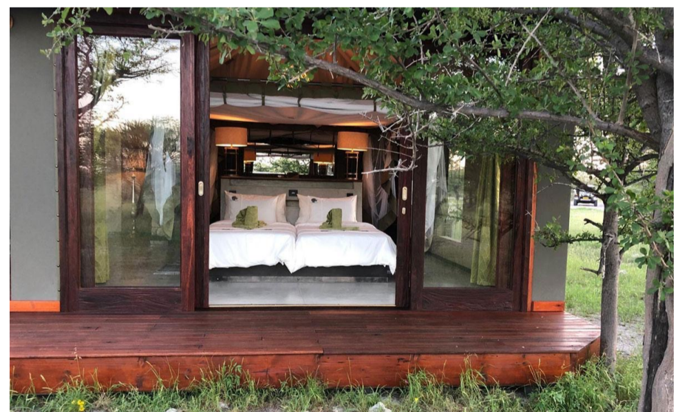
TWYFELFONTAIN TWYFELFONTAIN ADVENTURE CAMP