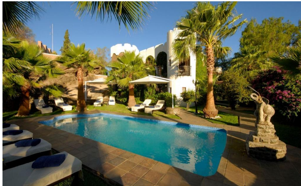
WINDHOEK: HEINITZBURG HOTEL