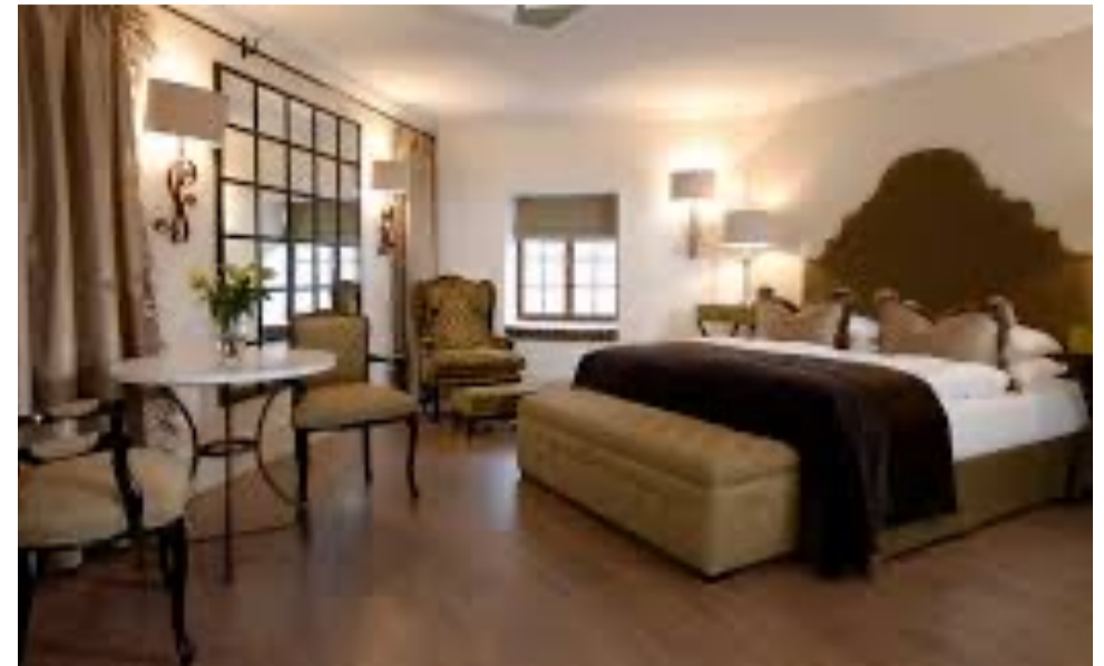
OTJIWARONGO: OTJIWA SAFARI LODGE