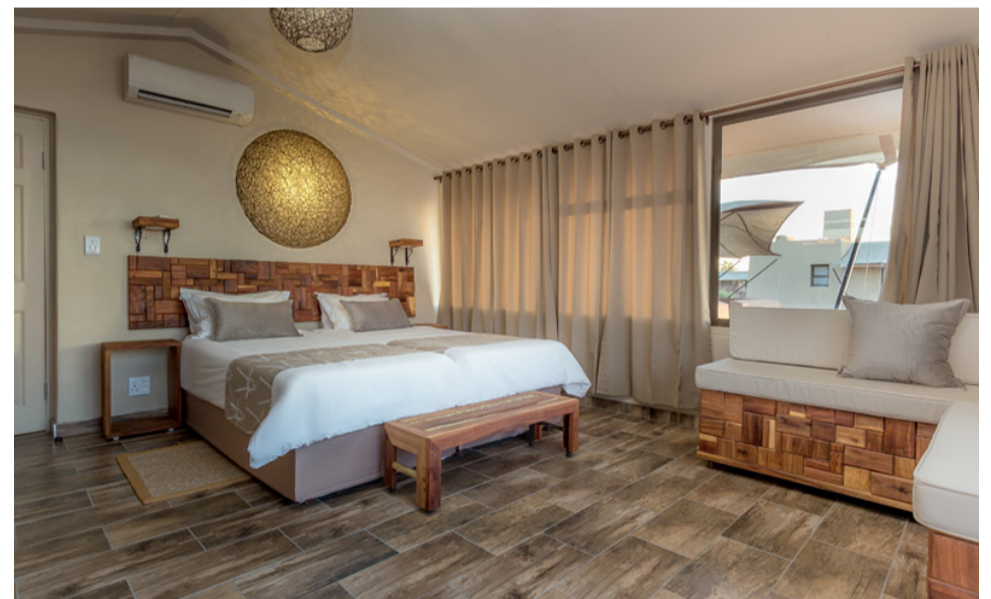
SESRIEM: GOCHEGANAS LODGE ELEFANT CHALET