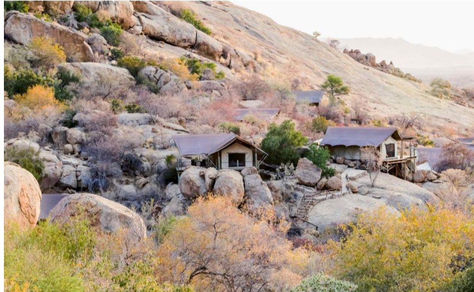
ERONGO: ERONGO WILD LUXURY TENT